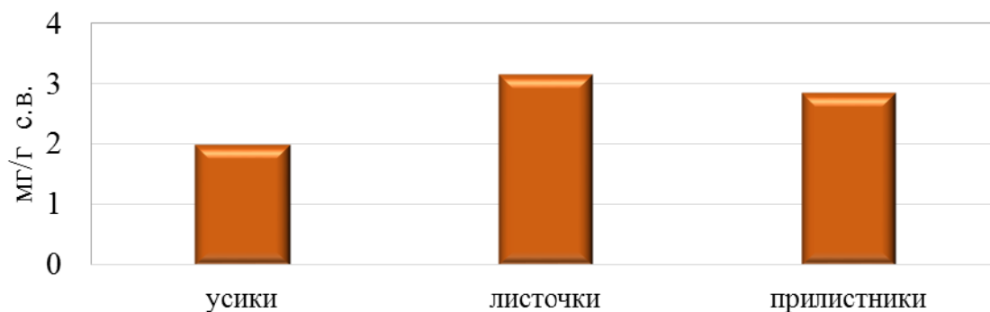
Рис. 1. Содержание каротиноидов в основных фотосинтезирующих органах растений пелюшки в фазу цветения.

У гороха наиболее изученными пигментами, участвующими в защитных механизмах клеток растений, являются каротиноиды и антоциан. Нами установлено, что больше всего каротиноидов синтезируется в листочках и прилистниках и меньше всего в усиках. В последних содержание пигмента отмечалось меньше, чем в листочках в среднем на 37%, а в прилистниках – на 30% (рис. 1).